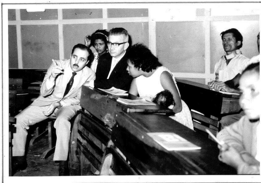
Figura 6 – Visita do Ministro Paulo de Tarso ao Círculo de Cultura do Gama, DF, acompanhado de Paulo Freire, coordenador do PNA, e sua equipe