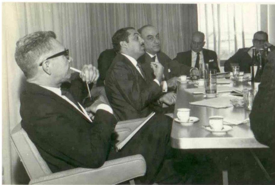
Figura 1 – Reunião do Conselho Nacional de Cultura com a presença de Roberto Marinho, Germano Galli, Edilson Cid Varela e Paulo Freire

A Figura 1 traz a imagem da reunião do Conselho Nacional de Cultura, com a presença do ministro Paulo de Tarso, em 29 de agosto de 1963.