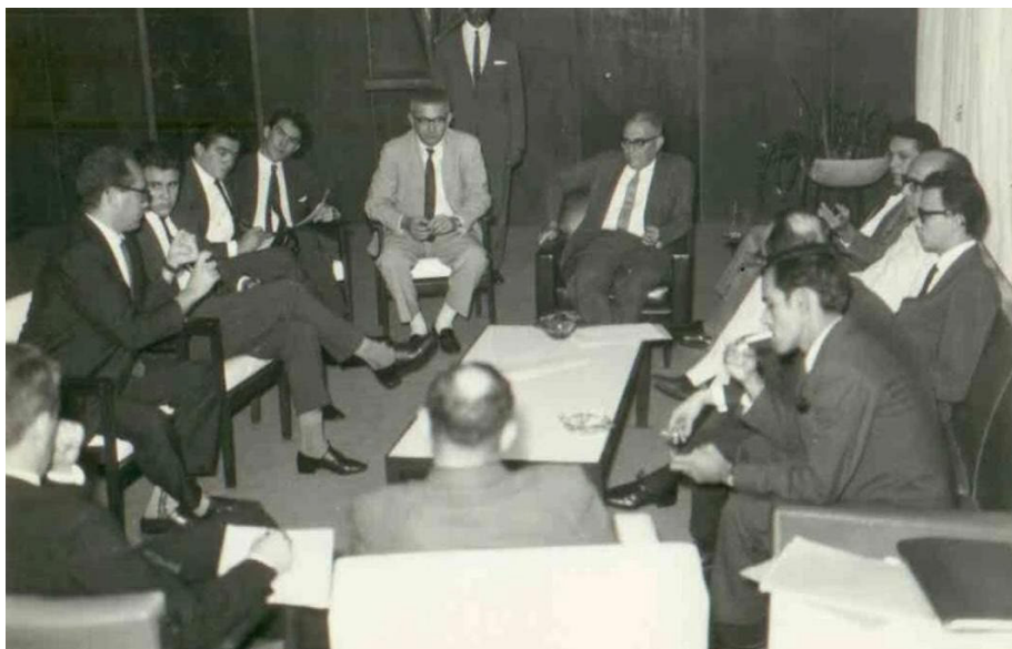
Figura 2 – Reunião no MEC para tratar da erradicação do analfabetismo com a presença do ministro Júlio Sambaqui e de diretores