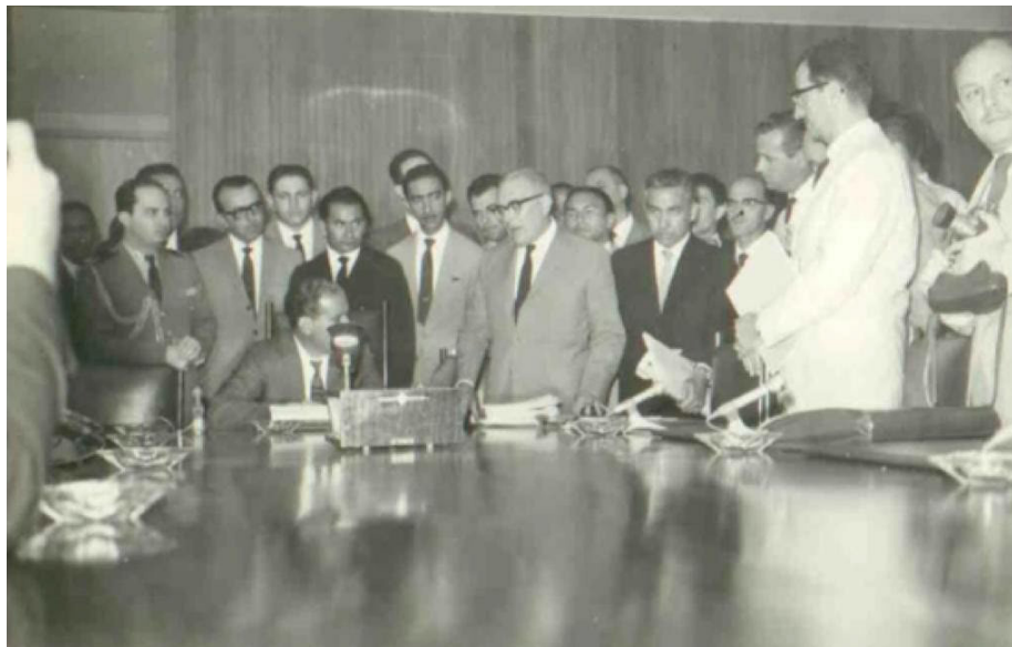
Figura 3 – Assinatura do decreto de implantação nacional do sistema Paulo Freire pelo presidente João Goulart com a presença de autoridades

Uma terceira imagem (Figura 3) registra o encontro de autoridades para a assinatura do decreto presidencial de implantação nacional do sistema Paulo Freire, em 25 de novembro de 1963, com a presença do gestor pioneiro do Distrito Federal, Armando Hildebrand.