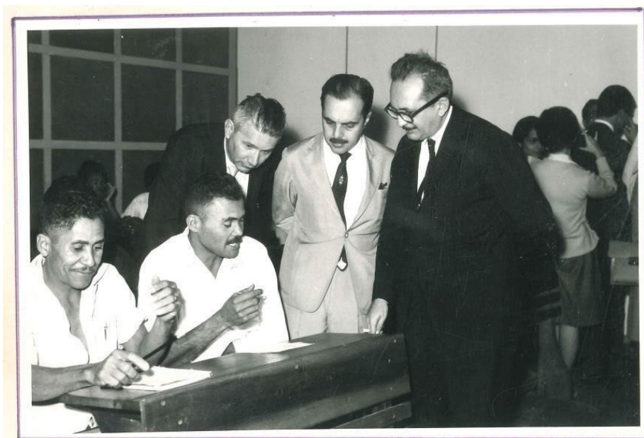
Figura 5 – Visita do Ministro Paulo de Tarso ao Círculo de Cultura do Gama, DF, acompanhado de Paulo Freire, coordenador do PNA, e sua equipe

Os círculos de cultura de Brasília foram visitados tanto pelo ministro Paulo de Tarso como por Paulo Freire. Curiosamente, numa dessas visitas, ficou registrado o momento em que, após a discussão da palavra geradora “tijolo”, o alfabetizador chamou a atenção dos aprendizes para o estudo das famílias silábicas do “ti”, do “jo” e do “lo”. Rapidamente, um dos alfabetizandos, demonstrando já ter apreendido o mecanismo da leitura, juntou as sílabas e formou, numa linguagem bem popular, a frase: “tu já lê”, que na Língua Portuguesa seria “tu já lê”.