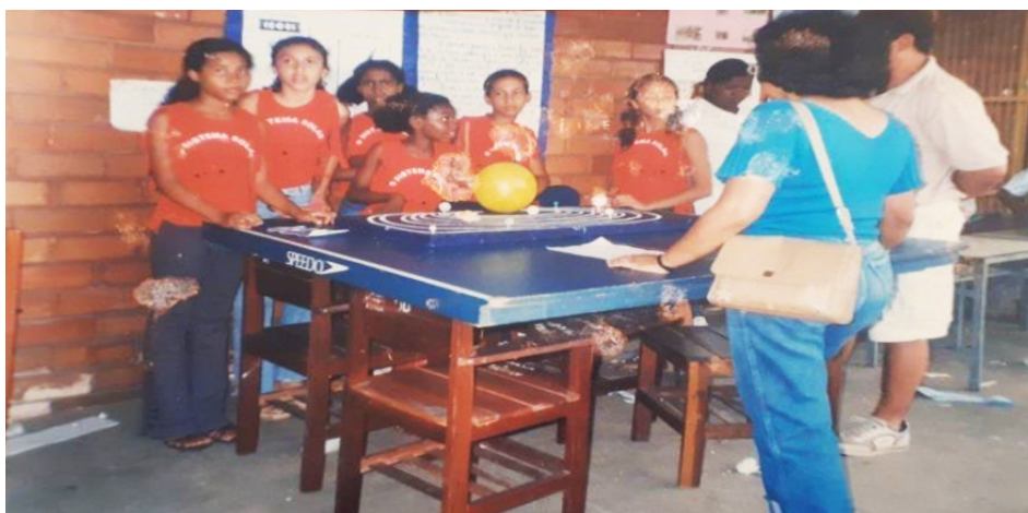
Figura 2 – Feira de ciências

Ao que parece, a localização do Colégio, fora do campus , não comprometeu o seu caráter de aplicação pedagógica. Considerando-se a garantia da oferta do ensino fundamental (1ª à 8ª série) e do ensino médio (1º ao 3º ano) até a virada do século, com prejuízo apenas da educação infantil ou pré-escola, retirada do currículo ainda nos primeiros anos da década de 1990; a ampliação do território atendido, com a entrada de alunos vindos de outras regiões da cidade, incluindo habitantes de bairros mais privilegiados em termos de localização geográfica, renda e escolaridade; e a regularidade de exposições científicas e demais eventos escolares até 2006, constata-se que, mesmo distante da cidade universitária e inserido na parte periférica do espaço urbano, o Colun deu continuidade à ação educativa projetada desde a sua reestruturação, preservando a natureza de seu funcionamento. A própria dinâmica da vida escolar, representada nas fotografias e nos relatórios de atividades, para citar apenas duas fontes do arquivo institucional, bem como em notícias jornalísticas que difundiram mais ainda tais formas discursivas e imagéticas (Pesavento, 2012), permite-nos afirmar que o papel desempenhado pelo Colégio de Aplicação, concebido como escola-laboratório da UFMA, campo de atuação do estágio supervisionado, veículo para a melhoria do ensino e espaço de formação permanente de crianças, jovens e adultos, foi mantido em sua essência naquele período.