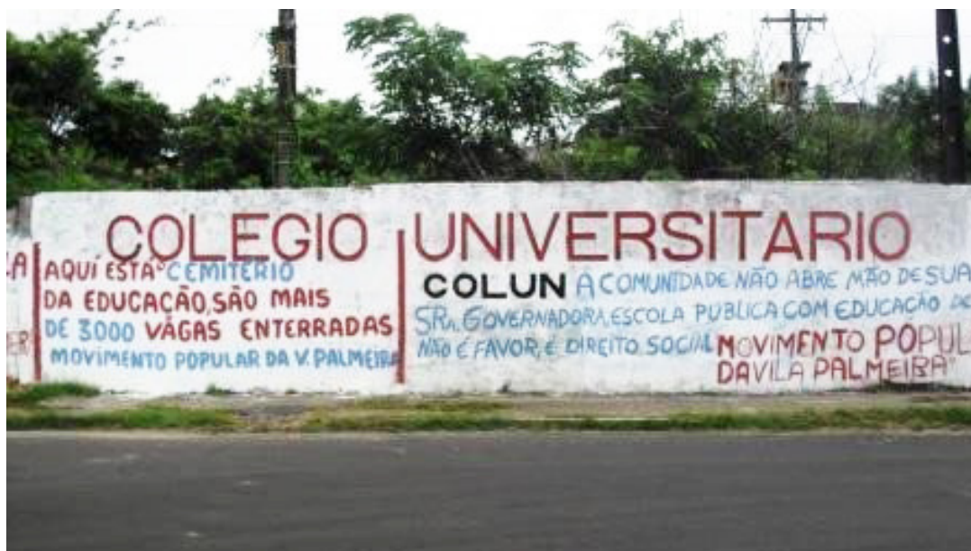
Figura 3 – Muro do Colun

finas, as emoções e os sentimentos [dos indivíduos] devem ser expressos e materializados em alguma forma de registro passível de ser resgatado [...]” (Pesavento, 2012, p. 34).