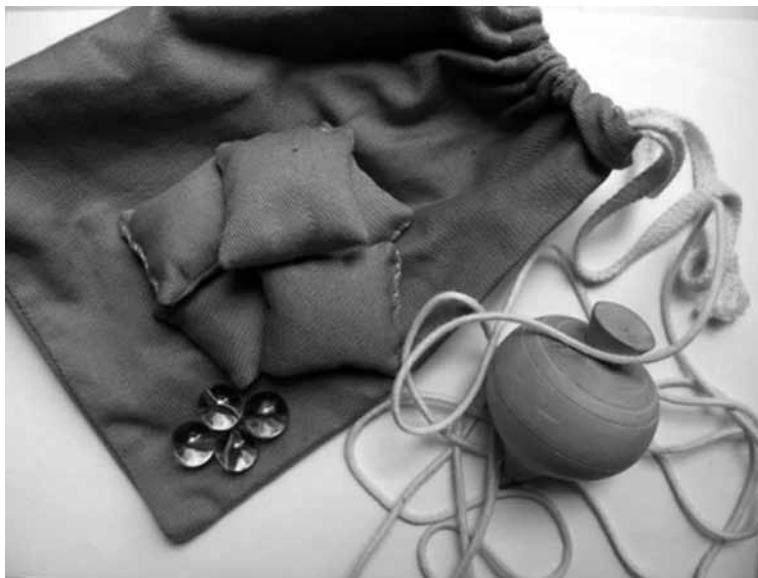
Figura 2: Pião em madeira, bolas de gude e jogo de seis marias

No intuito de determinar um número de registro que não possibilite apenas a contagem de peças, mas que ofereça informações, elaborou-se um “código” na forma de sequência que se inicia com a sigla do museu, seguida por cinco campos: MEC2008.000.000.0000.000000. O primeiro refere-se ao ano de inventário 10 , seguido pelo número da coleção à qual o objeto pertence, o número do tipo de objeto, número da quantidade daquele mesmo objeto dentro da série tipo de acervo e, por último, o número do objeto no universo geral do inventário. No caso de peças desmembradas, ou seja, que possuem mais de uma parte, como um jogo de “seis marias” (saquinhos de tecido preenchidos com arroz), definiu-se por, após o número geral, inserir a referência à parte, numa sequência também numérica, que informa o número do membro e quantos além dele