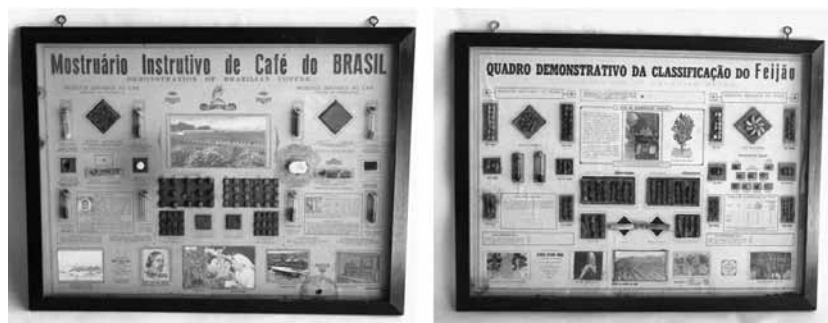
Figura 4: Mostruário de produtos agrícolas

Ainda com relação ao material didático usado nas escolas no início do século passado, faz parte do acervo uma coleção de quadros demonstrativos, oriundos da extinta Academia de Comércio de Santa Catarina. Alguns dados estão registrados nos próprios quadros, como autoria e origem, além da data de aquisição e um documento simbólico elaborado pelo diretor da instituição por ocasião da doação em 1996; simbólico, porque não atende às normas museológicas próprias para termos de doação.