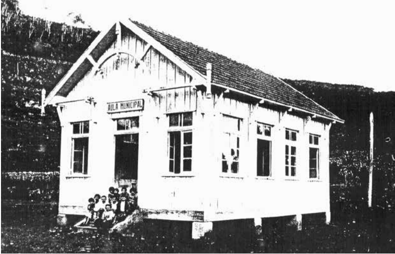
Imagem 2: Foto da Escola rural na Linha Palmeiro, Bento Gonçalves, 1930. A construção segue os parâmetros arquitetônicos projetados pelo engenheiro e ex-intendente de Bento Gonçalves, doutor João Baptista Pianca.