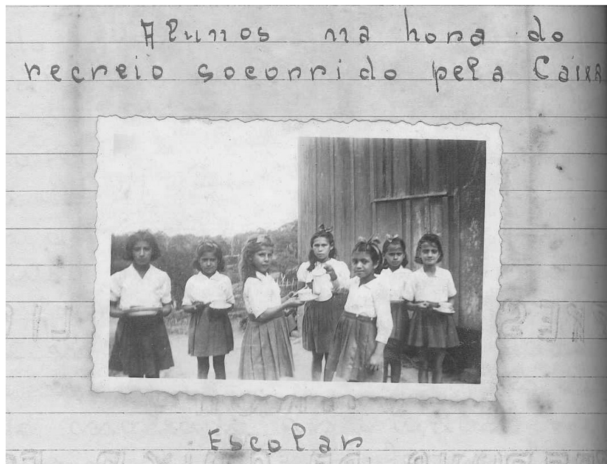
Figura 5 - Alunos socorridos pela caixa escolar.

Na próxima imagem (Fig. 5), está estampada uma das atividades comuns da caixa escolar, prevista na maioria de suas normativas: o fornecimento de merenda aos alunos. Embora esta ação seja recorrente nas descrições dos relatórios, ela é, até o momento, a única imagem encontrada de ações desta associação. A palavra ‘socorridos’ aparece com frequência nos relatórios, em listagens com nomes de ‘alunos socorridos’ pela caixa. É possível que a caixa não tenha se ocupado tanto da alimentação nas escolas, seja pela existência seja pela qualidade da ‘Sopa Escolar’.