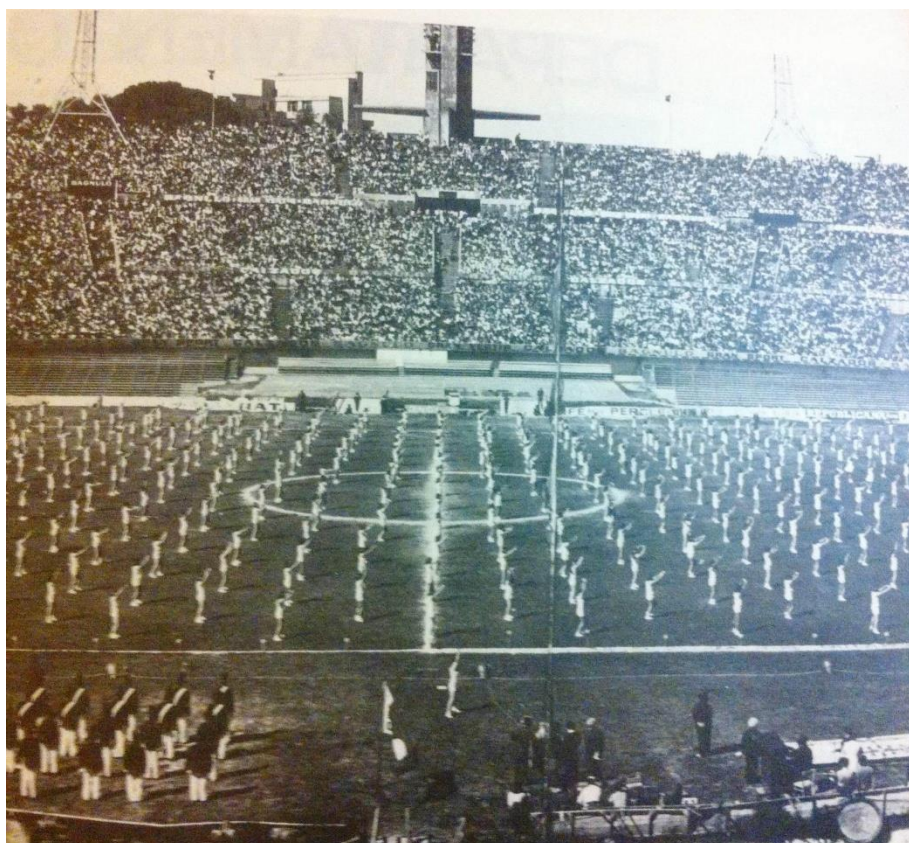
Imagen 4 - Estudiantes de enseñanza media en el Festival de Gimnasia realizado en el Estadio Centenario el 20 de noviembre de 1976.

Podemos decir que el proyecto se basó en resaltar la belleza de los cuerpos, la simetría en el espacio, la armonía, el arrojo de los movimientos, la expresión del esfuerzo, la disciplina, el sacrificio, en fin: 'el triunfo de la voluntad'. Todo esto sin dejar de apelar a la provocación de cierta fascinación por parte de los espectadores, evocando un componente afectivo, mimético, sobre el cual las coreografías gimnásticas en masa esperaban tener efecto. Sobre este aspecto es necesario una consideración respecto de la relación masa-individuo en las sociedades modernas, que son paradójicamente sociedades de masas que precisan de la figura del individuo. ¿Cómo juega el proyecto colectivo en la dictadura? Y, a la vez, ¿cómo juega en la práctica específica de la gimnasia? Si pensamos en la explosión de autoproducción de los cuerpos que tendrá su auge en el siglo XXI (la explosión de gimnasios, de nuevas modas, de consumidores de gimnasia, de la exaltación del cuerpo individual), ¿podemos pensar estos eventos masivos como resabios de una apuesta a un proyecto colectivo a través de la perfección coreográfica?