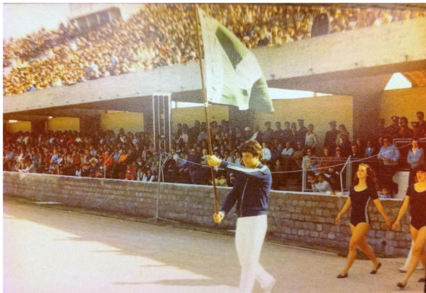
Imagen 3 - Selección de gimnasia ingresando a la cancha de un estadio deportivo en ocasión de una exhibición en la ciudad de Melo (entre 1978 y 1980).