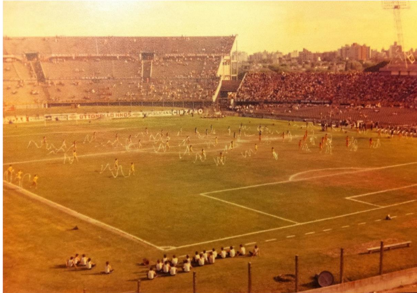
Imagen 2 - Ensayo preparatorio de muestra gimnástica a realizarse en ocasión del Mundialito (1980).