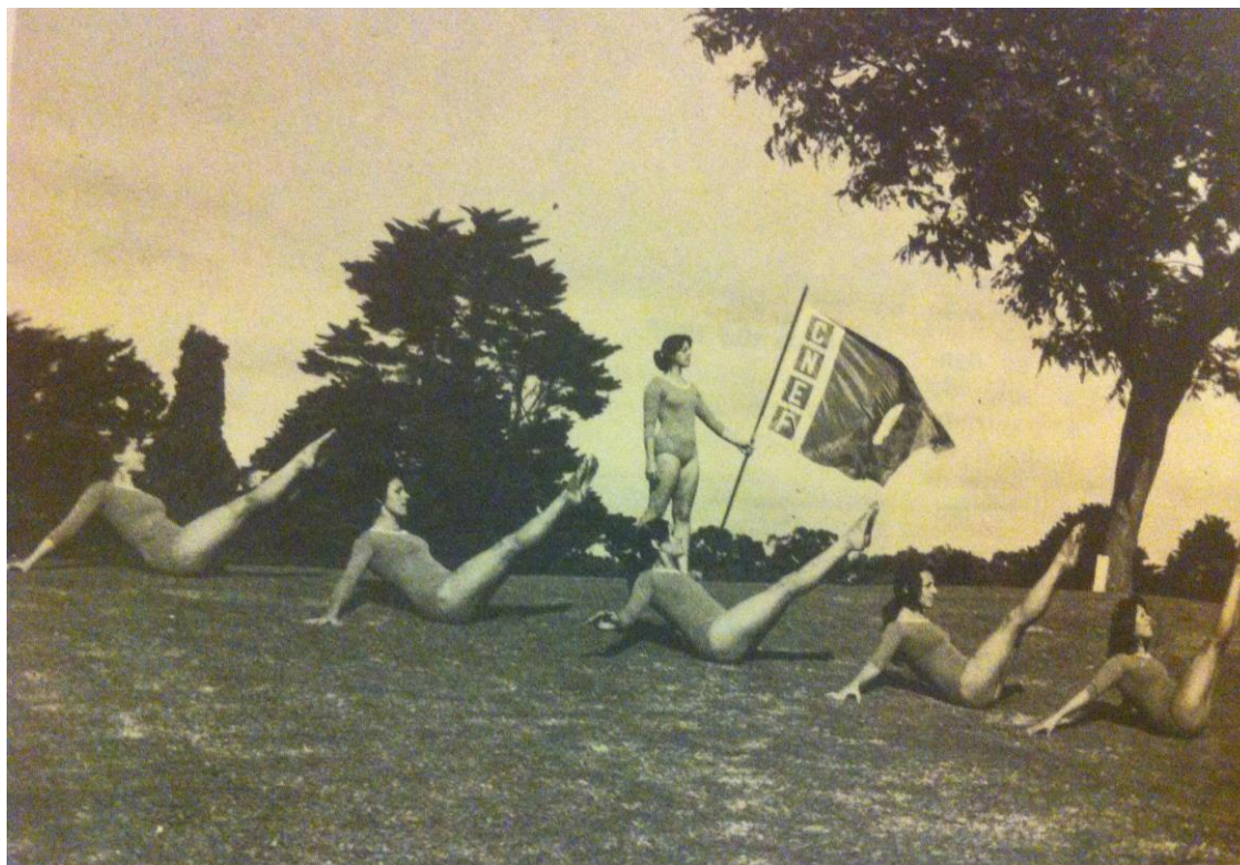
Imagen 1 - Actividad gimnástica al aire libre.