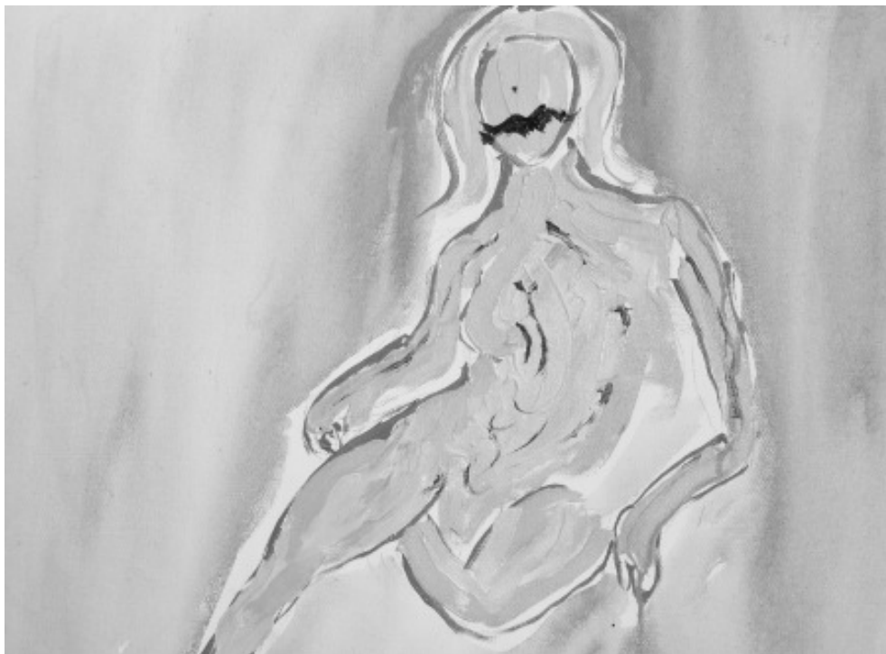
Figura 3: Autorretrato

En la nueva etapa de la investigación, el primer ejercicio (Figura 3) consiste en dejarme llevar por mis propias pinceladas, evitando la abstracción, para no orientarme rumbo a mis ideas y teorías. El objetivo es espejarme en mi cuerpo con los trazos arrojados a través de la tinta acuática del acrílico. Las mudanzas en mis afectos son dadas mediante los intervalos entre una pincelada y otra. Sin capas, sólo el arrebatado de los juegos de colores, las pinceladas establecen intervalos corporales. Me veo en un cuerpo múltiple, mas también, me miro en todos los cuerpos, ¿o en ningún?: