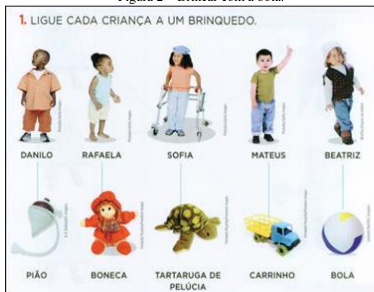
Figura 2 – Brincar com a bola.