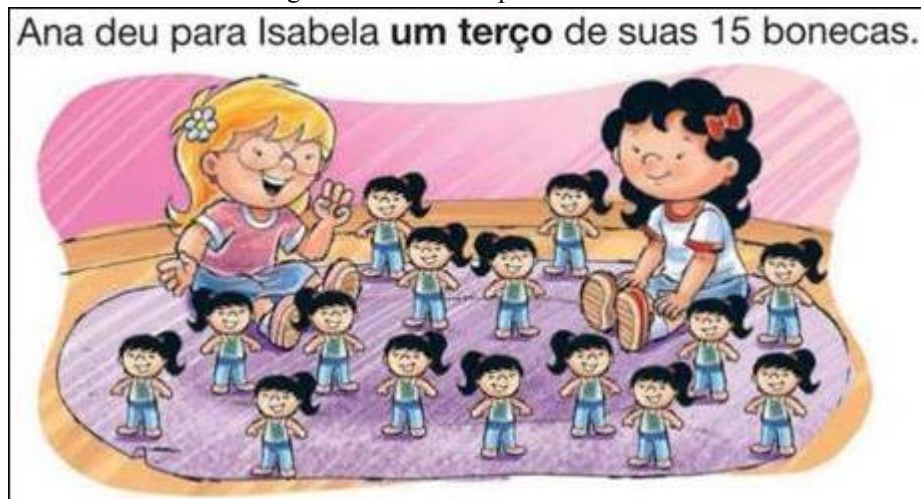
Figura 5 – Uma nova palavra.

É a miniaturização do humano, “como aquilo que permite colher e gozar a pura temporalidade contida no objeto” (AGAMBEN, 2005, p. 88) que constrói significado ao “cuidar do outro” como tarefa feminina. Transforma os significados do receber cuidados para o “cuidar do outro”, um aprender as tarefas fragmentadas da vida adulta.