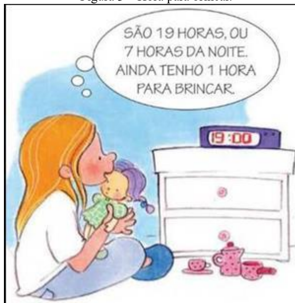
Figura 3 – Hora para brincar.