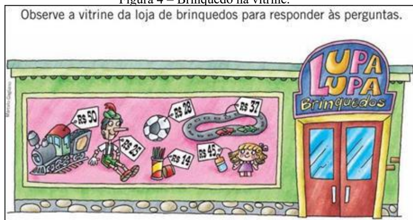
Figura 4 – Brinquedo na vitrine.

Sujeitos que brincam no currículo de matemática marcado pela dimensão de gênero no binário discursivo das representações dos livros didáticos atuam na construção de uma identidade aprisionada na criança-brinquedo, cria a ilusão hegeliana de expressar a vida em categorias reais. Meninos compram carrinhos e meninas compram bonecas são discursividades expressas na atividade da figura 4: “Juliana quer comprar a boneca” e “Ramon comprou a bola de futebol e pagou com 3 notas de 10 reais”, são frases contidas nessa atividade, cujo objetivo é ensinar às crianças como realizar operações básicas com unidades monetárias.