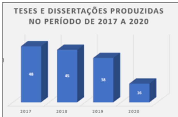
Gráfico 1: Teses e Dissertações produzidas no período de 2017 a 2020