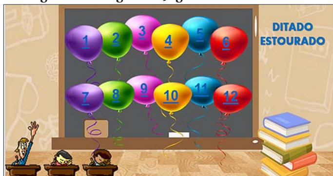
Figura 2 – Imagem do Jogo “Ditado Estourado”

Entretanto, há que se reconhecer a ênfase dada aos recursos visuais. A estratégia de apresentá-los como animação estabelece uma atmosfera de surpresa para o que há de vir e demonstra o empenho em envolver o estudante surdo. Além desse aspecto, há uma releitura de uma antiga proposta pedagógica que era oral e, agora, adapta-se ao cenário tecnológico. Nesse sentido, Vieira, Oliveira e Pimentel (2020, p. 279) afirmam que: “[...] os tempos mudaram, as gerações mudaram e com o avanço das tecnologias as brincadeiras também mudaram”. E a escola, por sua vez, vai acompanhando as mudanças e evoluindo com elas.