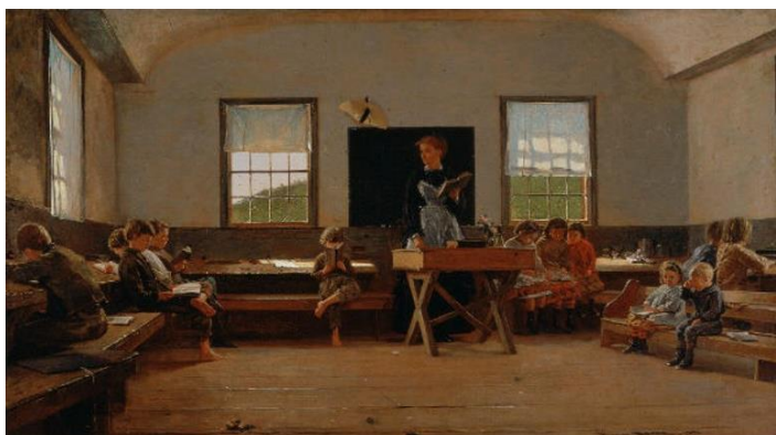
Figura 1 – The Country School

Tomemos, como ponto de partida, a dimensão da aula. Em termos gerais, a organização do trabalho pedagógico em uma aula envolve a participação de sujeitos envolvidos com o processo educativo, que performam diferentes papéis sociais e ocupam os tempos e espaços que compõem a ação formativa que se pretende empreender. Dessa forma, é possível inferir que a aula tem contornos e dinâmicas próprias, que envolvem uma série de mediações que a emolduram. Tais mediações foram retratadas de distintas formas ao longo da história da educação e da arte, como é possível observar na obra de Winslow Homer (1871):