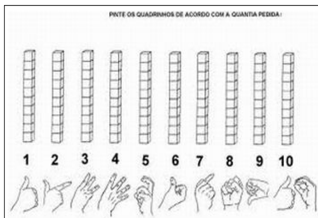
Figura 2 – Atividade de leitura do numeral em LIBRAS na aula “Aprendendo a se comunicar usando as mãos”