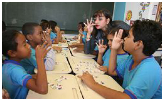
Figura 4 – Matéria “Aulas de Libras mudam comportamento de alunos ouvintes” veiculada no Jornal do Professor