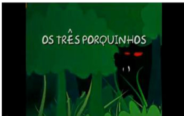
Figura 1 – Vídeo “Os três porquinhos em Libras” veiculado no Espaço de Aula