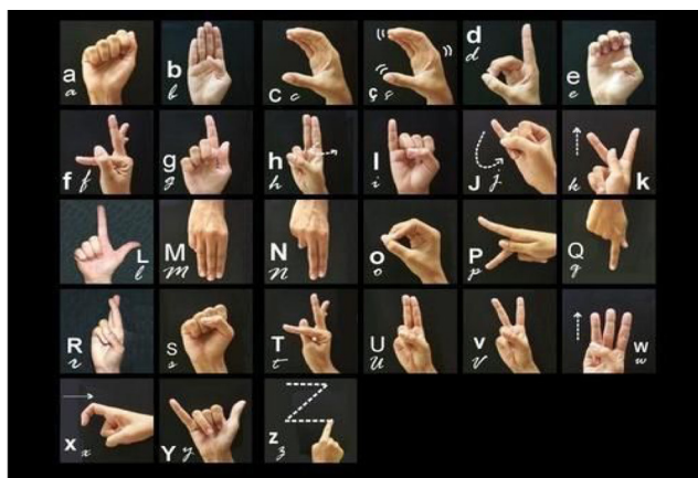
Figura 3 – Alfabeto em Libras – Imagem veiculada na aula “Deficiência Auditiva: entendendo como se formam os sons e como os captamos”