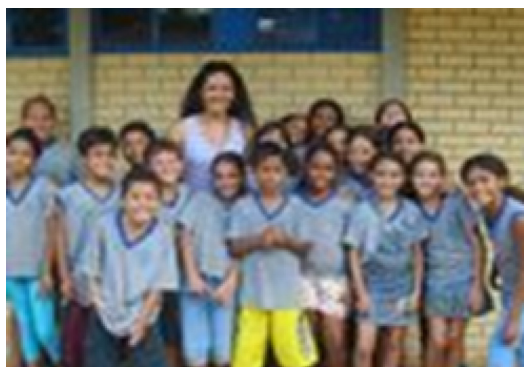
Figura 5 – Matéria “Língua de Sinais ajuda escola a melhorar rendimento de estudantes” veiculada no Jornal do Professor