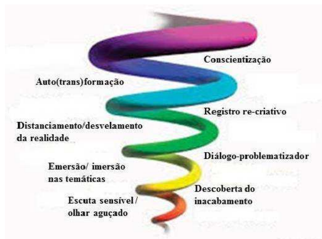
Figura 1 - Movimentos metodológicos dos círculos dialógicos investigativo-formativos

Os movimentos metodológicos dos Círculos Dialógicos Investigativo-formativos “não ocorrem linearmente ou de forma estanque; todos estão imbricados uns nos outros, dentro da processualidade dialética de uma espiral” (HENZ e FREITAS, 2015). Na figura abaixo, apresentamos, de forma sistematizada, os movimentos já observados ao longo das pesquisas.