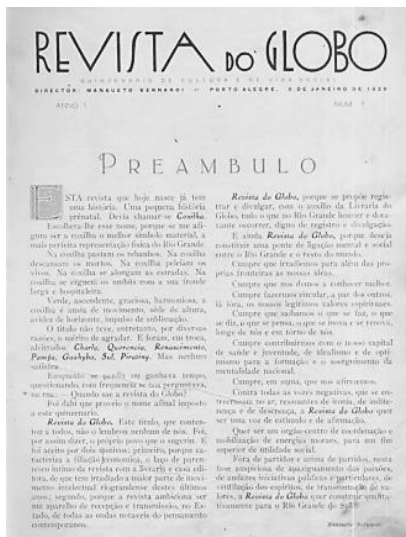
Figura 3: Preâmbulo