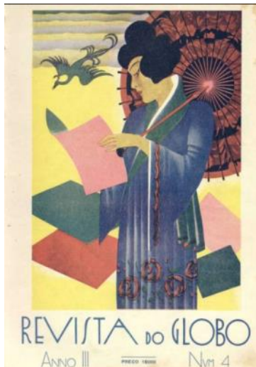
Figura 4: Capa da Revista do Globo