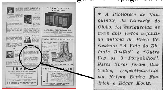
Figura 11: Propaganda de livros da Biblioteca de Nanquinote .