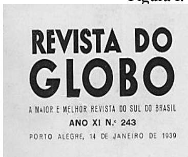
Figura 1: Imagem da primeira página da Revista do Globo