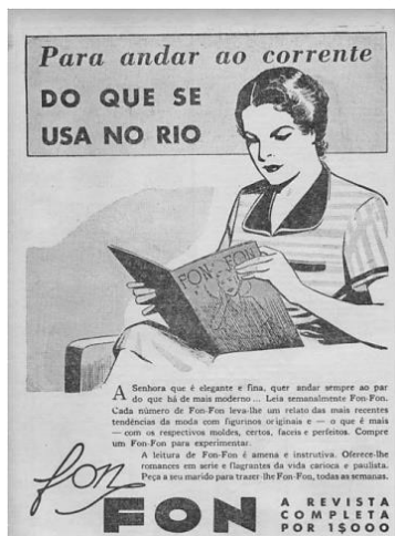
Figura 5: Propaganda da Revista Fon-Fon