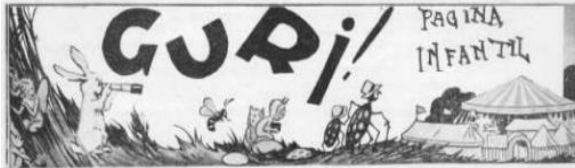
Figura 6: Cabeçalho da Página Infantil da Revista do Globo